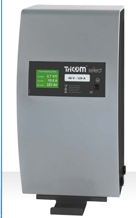
Ladegerät TriCOM select, Gehäusetyp WT 120